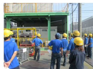
各元栓、主電源の確認