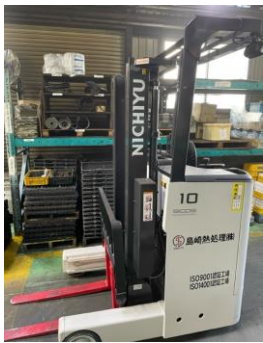
新規フォークリフト

21年度より当社はフォークリフトの災害を無くす為に労働安全推進委員会にて安全運転講習「フォークリフト作業における災害事例と予防策」などを実施しフォークリフトの災害ゼロ活動を行っております。又災害ゼロ活動と並行してフォークリフトを少しでも長く、綺麗に乗れるようにする目的で管理の徹底を行っております。