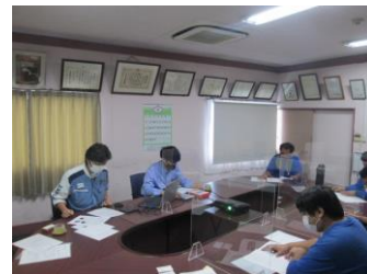
安全運転講習の様子