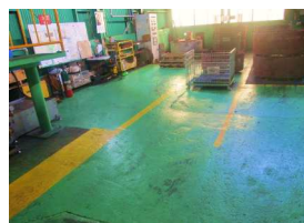
床にペンキを塗り、ラインも引き直し、作業がやり易くなりました。