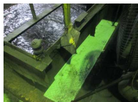
油槽に隙間があり落下の危険性があるので、鉄板を溶接しました