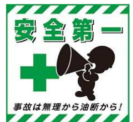
表面担当 S-1グループ 山村