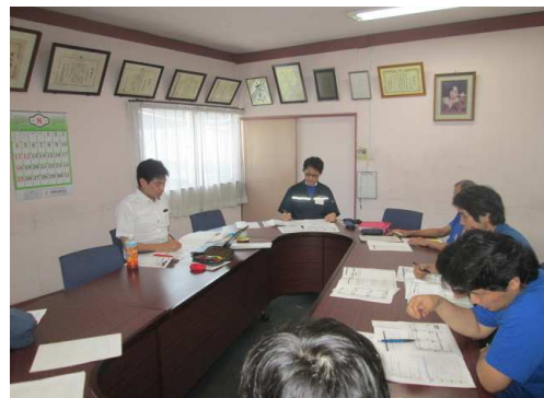
前回コンサルティングの様子

来月には人事評価年間スケジュールの中間面談に移ります。 初めての取り組みでもあり、全員が進捗に関して不慣れな部分もありますが 一歩一歩しくみづくりに取り組んでいる状況です。