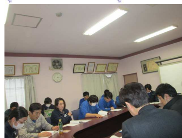
この日は設備の稼働を止め全員参加です。

今年では中期経営計画期間の最後の年になります。 従業員全員団結して、よりよい会社になるよう頑張ります。