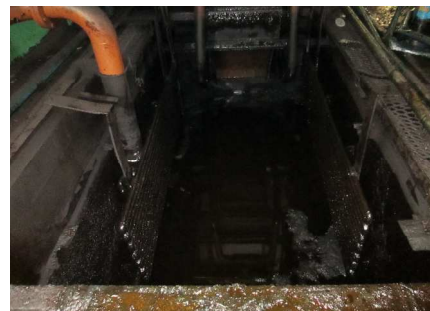
溜まっていたスラッジがなくなりました。