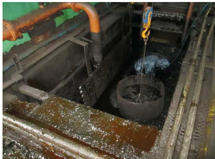
カゴ一杯にスラッジがとれます。