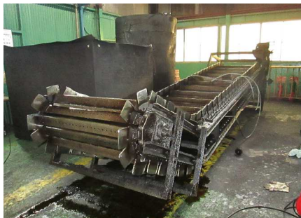
ベルトコンベアを外して行きます。