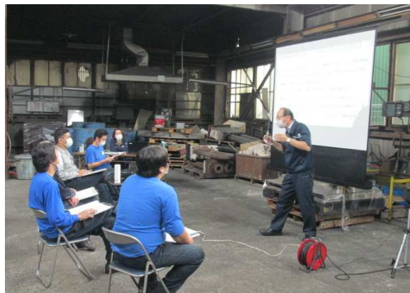
上位職者への講義中