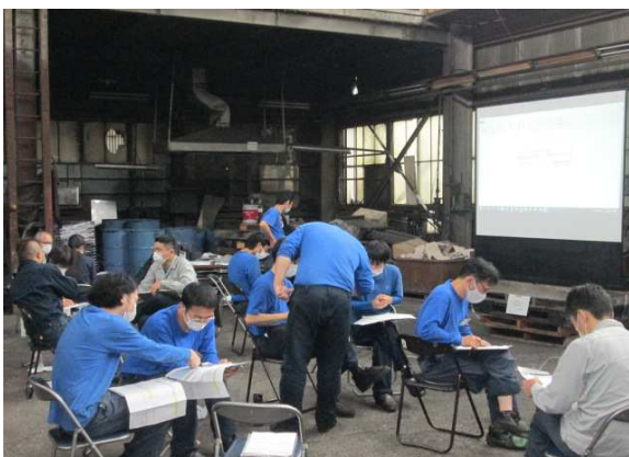
目標シート作成中

この号が発行される頃には、全員面談が終わり目標が決定し、各々その達成の為に、行動を開始しているはずです。上手い出来ない事も出てくると思いますが、皆さん頑張ってください。