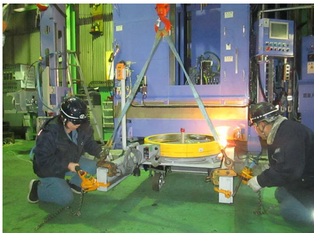
脱着機設置工事の様子

高周波の新設備が昨年の6月末に搬入され、10月には火入れ式が執り行われましたが、まだ稼働できる状態ではありませんでした。既存の高周波設備で処理していた製品は一部を除き、人力で脱着が可能なサイズ・重量でした。以前のSIMCO通信でも取り上げられていましたが、新設備では300φの製品まで処理できるようになります。今より、太く、長く、重い製品はとて人力では扱えません。そこで、業者さんに相談し脱着機を製作してもらい、今月初旬に無事、搬入・設置されました。新設備の搬入からかなり時間が経ちましたが、着実に稼働に向け進んでいます。